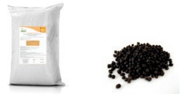
SAC DE 25 Kg