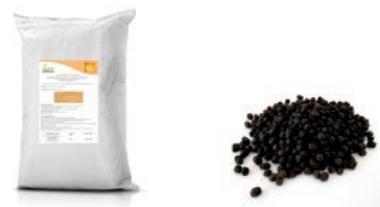
SAC DE 25 Kg