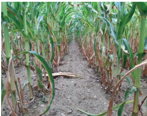
Microstarter DAP 18-46