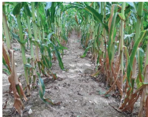
Greencrops Lombricompost Granulé standard «S»