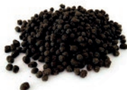
SAC DE 25 Kg